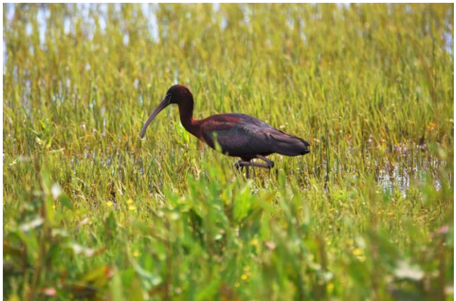
Zwarte Ibis

De vogel leeft in natte natuurgebieden. Dat betekent meteen dat deze soort het steeds lastiger krijgt om te overleven. Het voedsel bestaat uit kevers, libellen, bloedzuigers en zo meer.