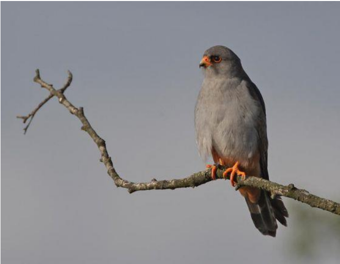
mannetje roodpootvalk