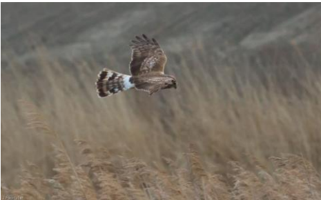
vrouwtje blauwe kiekendief

Na de Tweede Wereldoorlog werden vooral op de Waddeneilanden en in Groningen tot wel 140 succesvolle broedparen waargenomen. Maar na 2000 werden er nog maar 70 broedgevallen geteld. En alleen op Texel waren er nog 20 paren van "de Baluwe Skor". Dat is Texels dialect. En nu in 2022 zijn er in totaal minder dan 10.