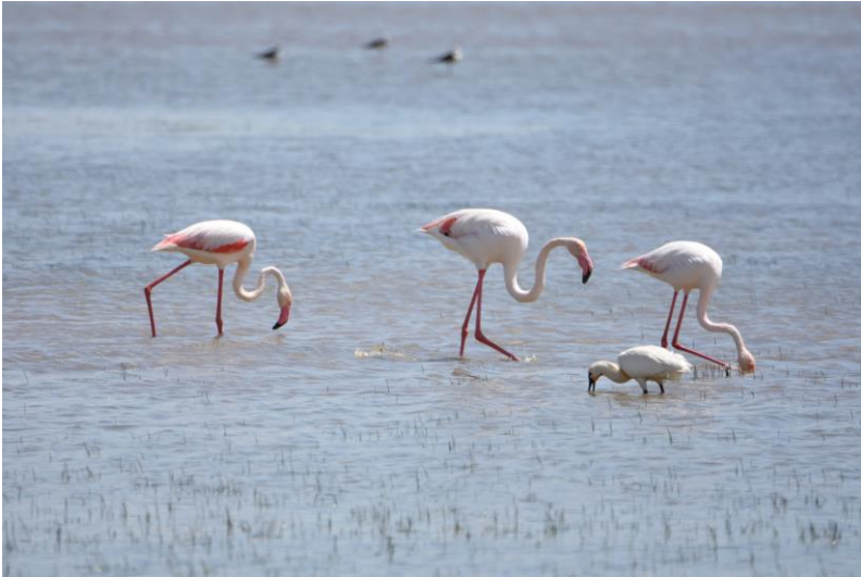
Flamingo's en een lepelaar