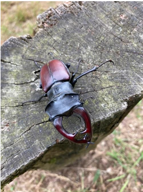
vliegend hert

Blijkt dat de stenen al in 1957 zijn geruimd. De teleurstelling was gauw verdwenen want op één van de houten palen zat een vliegend hert.