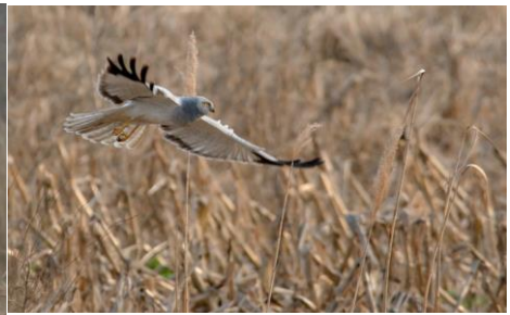
mannetje blauwe kiekendief